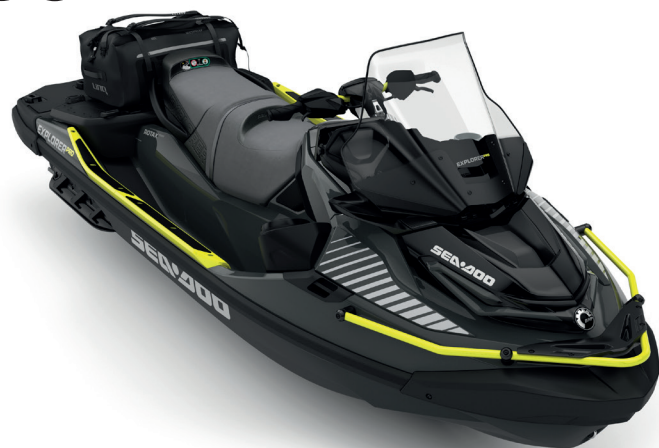
● Iceland Grey